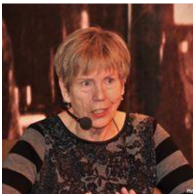
Karin Fossum, med en av årets bestselgere, «Hviskeren», var for første gang på SILK