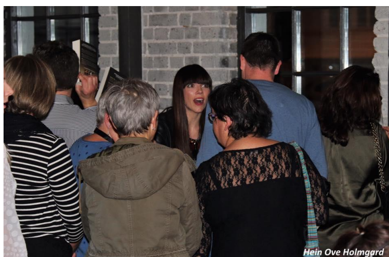
Kate Morton har solgt mer enn 10 mill.bøker- mange publikummere ville ha signerte bøker