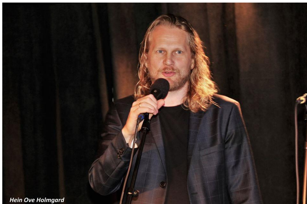
Aslak Sira Myhre åpnet SILK-festival nr. 7

ble arrangert 2-5 Nov 2016 og ble åpnet av Adm. direktør i Nasjonalbiblioteket Aslak Sira Myhre.