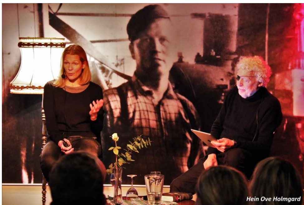
Åsne Seierstad - gripende fortelling om «To søstre». Intervjuet av Odd Karsten Tveit