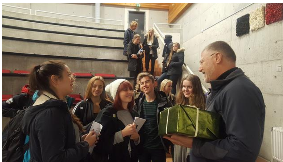
Elever på vid. skole hadde mange spørsmål til forfatter Deon Meyer om dagens politiske situasjon i Sør-Afrika og hans forfatterskap